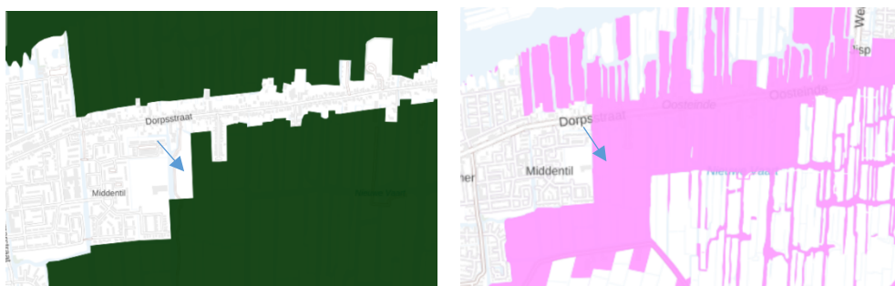
Kaart 3: Natuurijsbaan terrein in de PRV (links, grenzend aan Bufferzone) en in OVNH2020 (volledig binnen BPL)

Tijdens de behandeling van OVNH2020 door PS op 5 oktober 2020 is een motie ingediend door FvD en CDA met het voorstel om het werkingsgebied BPL te verwijderen van het natuurijsbaanterrein t.b.v. het verplaatsen van sportvoorzieningen vanuit het binnen-dorp. Deze motie is door PS verworpen.