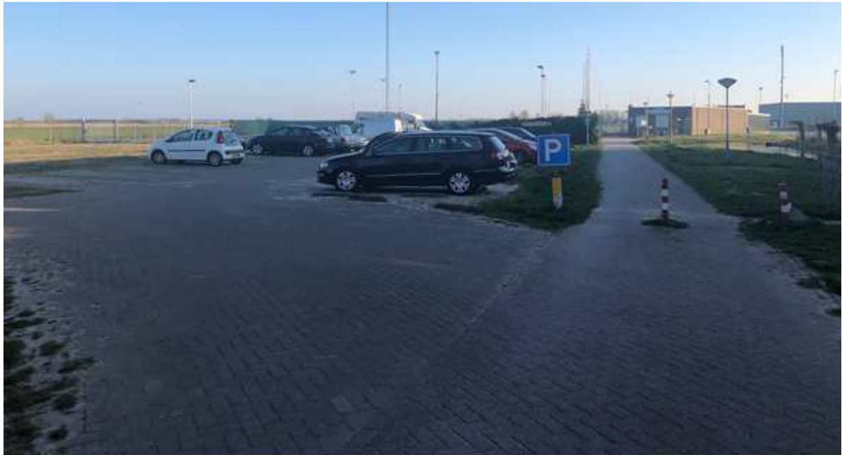
(Foto genomen vanuit het lint richting het parkeerterrein en de jeu de boulesvereniging met daarachter de huidige natuurijsbaan)

Ook de ijsbaanlocatie wordt in de Omgevingsverordening NH2020 bestempeld als Bijzonder provinciaal landschap. Dit moet een omissie zijn. In de eerste plaats is de ijsbaanlocatie met een sportbestemming immers niet van bijzondere landschappelijke waarde. Van openheid en ruimtebeleving bijvoorbeeld al geen sprake.